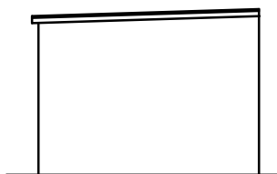
ELEWACJA POŁUDNIOWA 1:100